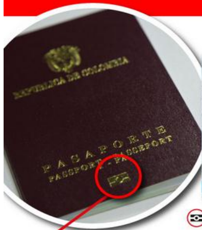
Icono de chip grabado en la portada que identifica el pasaporte electrónico

SE EMPEZARÁ A EXPEDIR DESDE EL 1 DE SEPTIEMBRE DE 2015